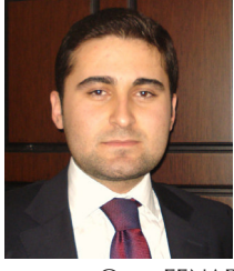
Cözüm Mimarı Software AG Türkiye